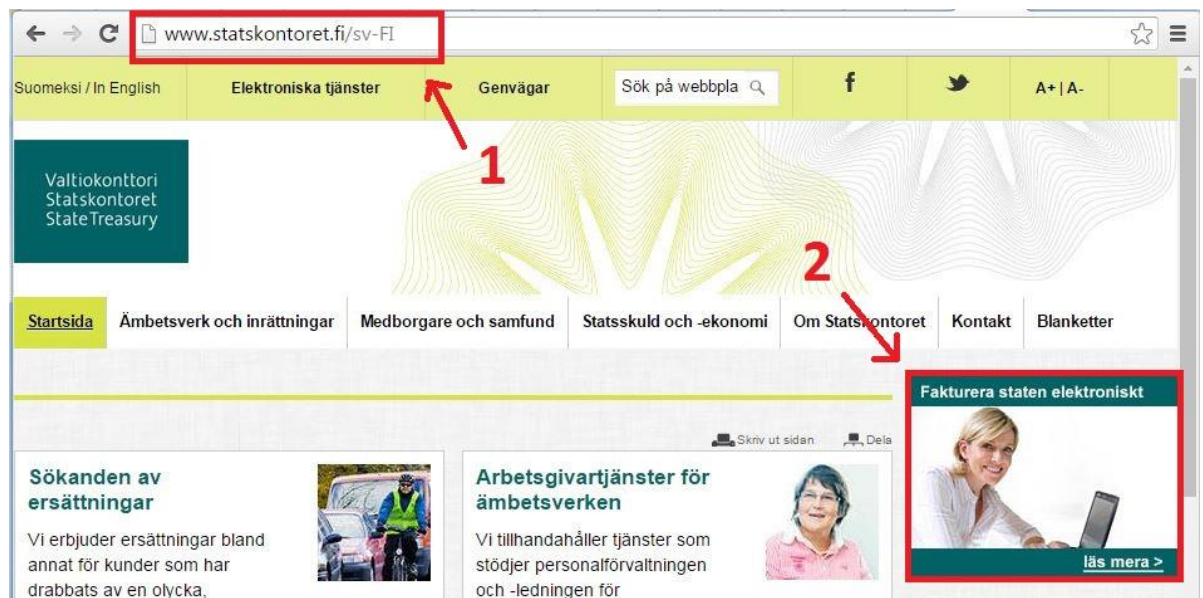
Bild 1. Gå till webbplatsen www.valtiokonttori.fi på det sätt som bilden visar:

Till höger på den sida som visas finns rutan bild 2 : Fakturera staten elektroniskt. Klicka på bilden, varvid statens webbplats för nätfakturering öppnas.